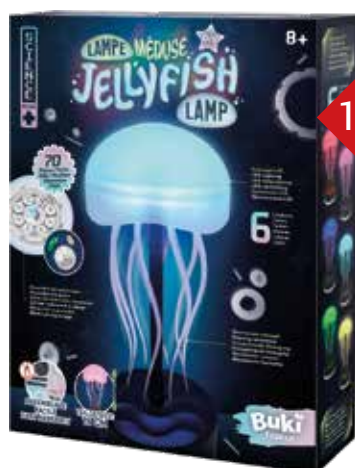
1188 LAMPE MEDUSE A assembler soi-même, hauteur 20cm, lampe change de couleurs automatiquement. Système de moteur et d'engrenages qui font onduler les tentacules. Fonctionne sur secteur, câble USB-C inclus.