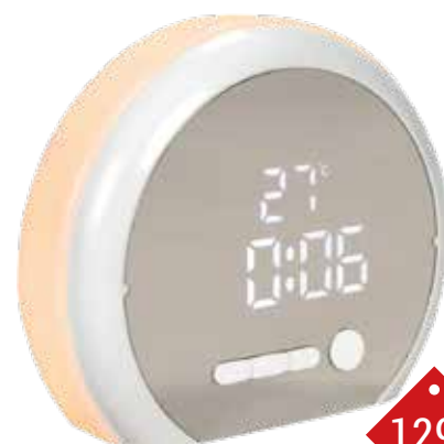
1298 REVEIL MIROIR LUMINEUX Lumière de réveil progressive, 3 niveaux de luminosité, mode nuit avec réduction de la luminosité de l'affichage LED, affichage de la température et alarme avec fonction snooze.