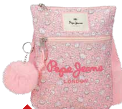
1163 POCLETTE ROSE Pochette Pepe Jeans 20 x 24cm.