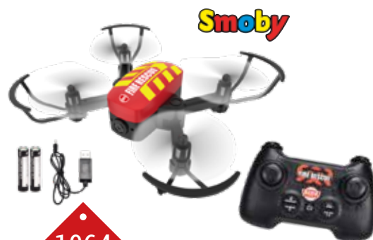
1064 DRONE POMPIER Ce drone de 12cm est équipé d'une télécommande avec fonctions complètes de pilotage et fonction rotation pour réaliser des figures. 3 modes de vitesse. A partir de 8 ans.