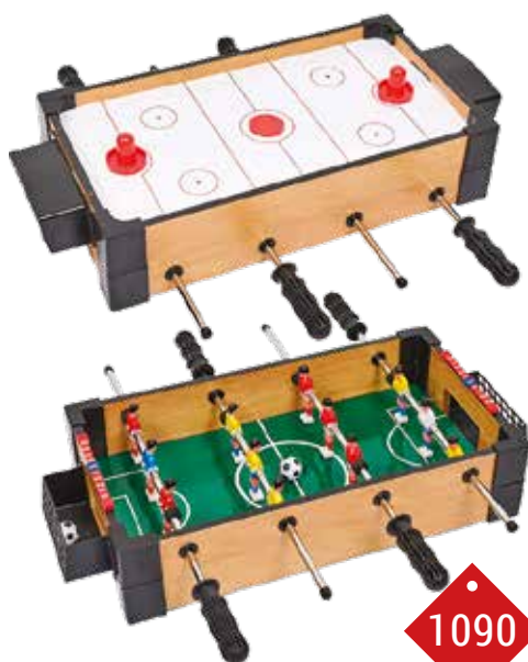
1090 TABLE DE JEUX 2 EN 1 Un mini jeu de baby foot et un mini jeu de hockey pour des heures de jeux et de rigolade.