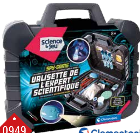
0949 VALISSETTE DE L'EXPERT SCIENTIFIQUE Relève les empreintes digitales, réalise des moulages en plâtre, répertorie des preuves, sécurise la scène de crime et décode des messages secrets. A partir de 8 ans.