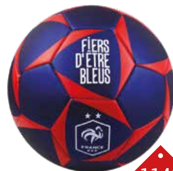
1140 BALLON FOOT FFF JERSEY Ballon de football FFF en jersey taille 5, poids 400gr.