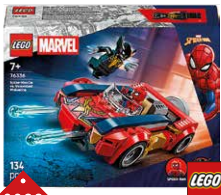
0932 SPIDERMAN ET SA VOITURE CONTRE WOLVERINE A partir de 7 ans.

*le choix 2 sera pris en compte seulement si choix 1, non disponible