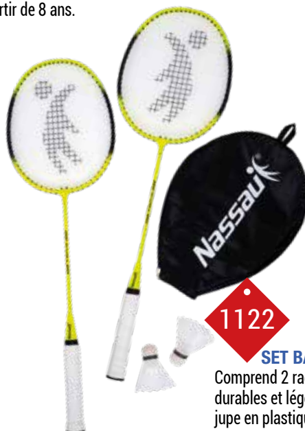
1122 SET BADMINTON NASSAU Comprend 2 raquettes en acier de 120g, durables et légères et 2 volants avec jupe en plastique.